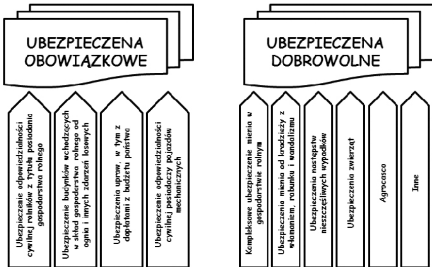
Rysunek 2. Rodzaje ubezpieczeń w rolnictwie

Czy warto korzystać z tych ubezpieczeń, co one nam dają? A może to tylko dodatkowe koszty, które obniżają dochody naszych gospodarstw? Warto się nad tym zastanowić i podjąć odpowiednie decyzje. Nasze gospodarstwa i produkcja narażone są na wiele czynników, których nie jesteśmy w stanie przewidzieć i kontrolować np. – prowadzimy produkcję „pod chmurką”. Zachodzące zmiany na rynku obligują nas do inwestowania w maszyny, urządzenia, budynki i budowle, które pozwalają nam rozwijać produkcję. To nie wybór, lecz konieczność wiążąca się z angażowaniem znaczących środków finansowych (własnych, kredytów, dotacji). Uważamy, że jest to bardzo ważne i godne poważnego przemyślenia. Stawiamy na jednej szali majątek, który bardzo często budowało kilka pokoleń – czasami majątek całego życia. Szczególnie istotne, jeśli korzystamy z zewnętrznych źródeł finansowania prowadzonej produkcji lub realizowanych inwestycji.