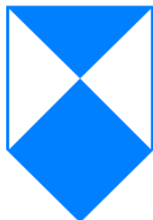
Polski znak zabytków