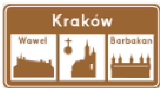
Znak E-22C Informacja o obiektach turystycznych

Nie pobiera się opłaty za zajęcie pasa drogowego w związku z umieszczaniem w pasie drogowym tablic informujących o nazwie formy ochrony przyrody oraz znaków informujących o formie ochrony zabytków (ustawy z dnia 16 kwietnia 2004 r. o ochronie przyrody oraz znaków informujących o formie ochrony zabytków).